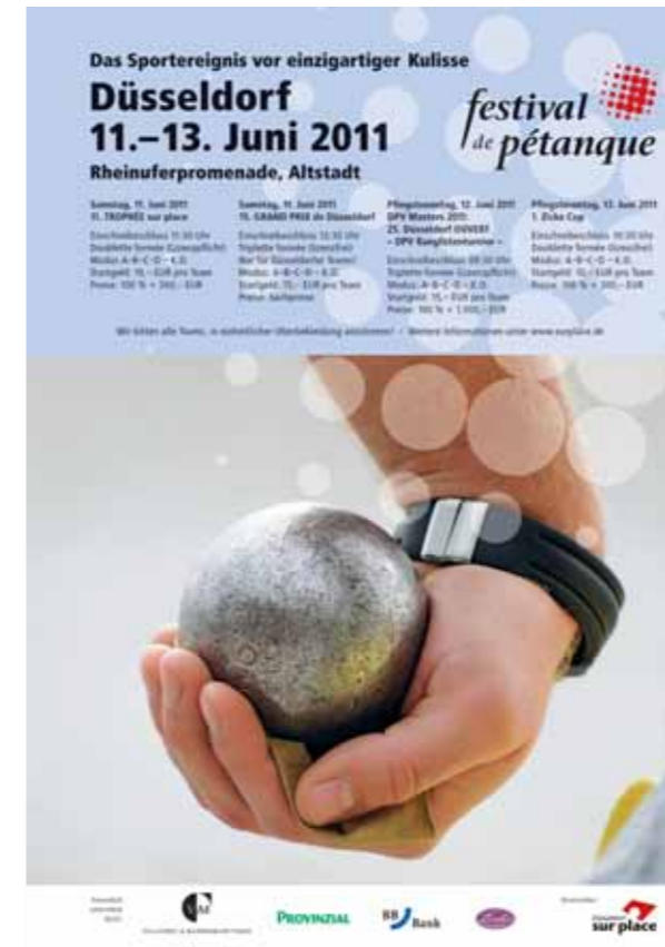
Verteilung und Aushang von DIN A3 Postern