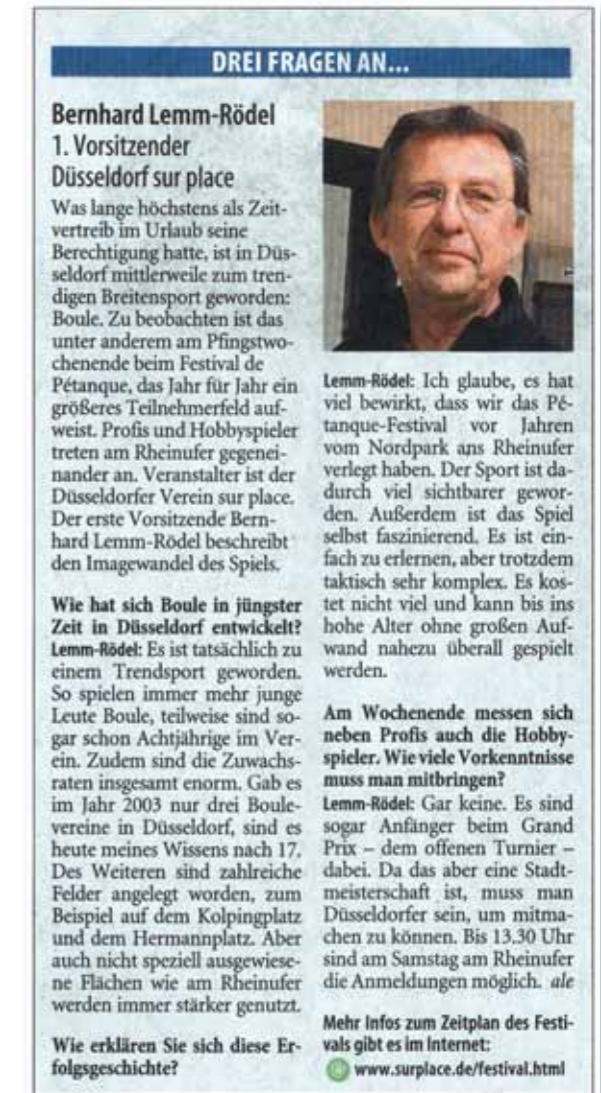
Vorankündigungsartikel – hier Westdeutsche Zeitung vom 8. Juni 2011