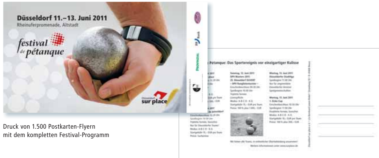
Druck von 1.500 Postkarten-Flyern mit dem kompletten Festival-Programm

Gezielte Maßnahmen für ein besonderes Ereignis