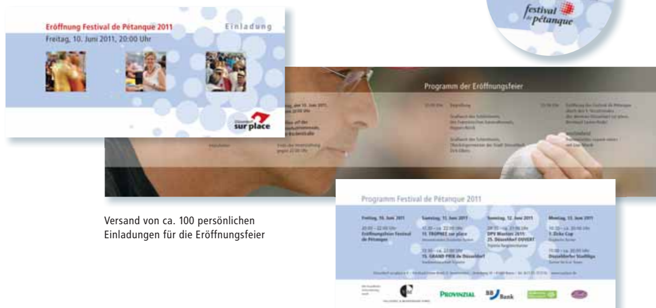
Versand von ca. 100 persönlichen Einladungen für die Eröffnungsfeier