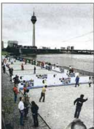
Turnier: Hier wurde „Boule“ am Rheinufer gespielt.