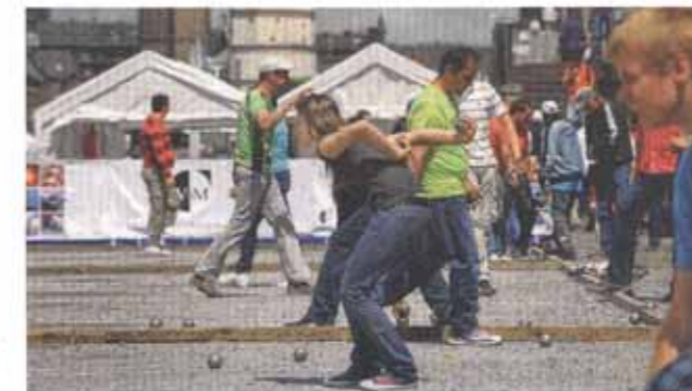
Beim Pétanque, das auch Boule genannt wird, sind Konzentration und eine präzise Technik wichtiger als Kraft.